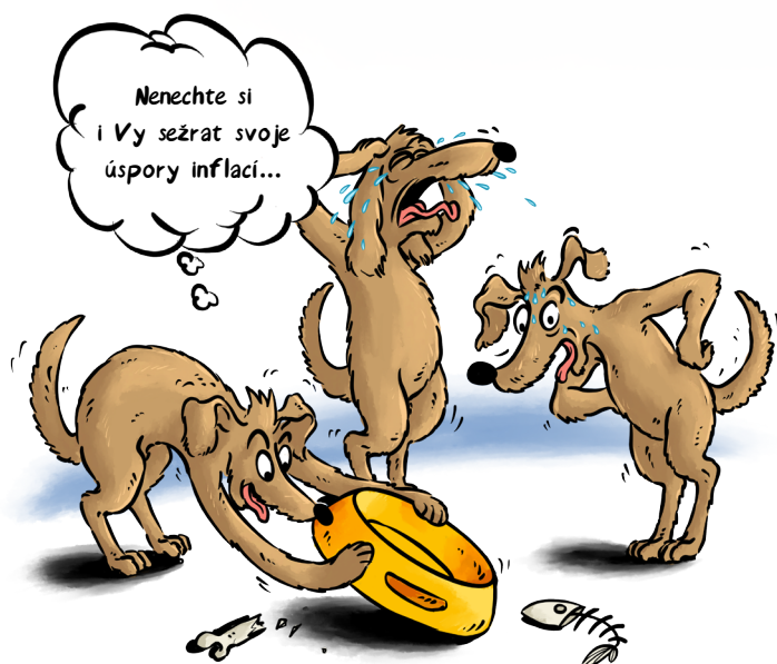
ČÁSTKA NA BĚŽNÉM ÚČTĚ, ČI DOMA 100.000,-

V prvním čtvrtletí roku 2022 se očekává meziroční inflace k 8%, možná až k 10%. Potom ekonomové předpokládají, že by inflace mohla klesat. Pro ochranu financí proti inflaci dnes existuje řada nástrojů. Ať jsou to různé typy dluhopisů, nemovitostní fondy či komodity. Rádi vám v tom poradíme.